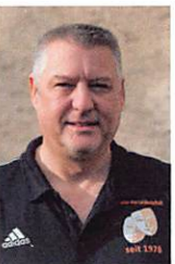
Peter Mülhörer Bühnenbau