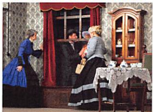
Szenen aus „Arsen und Spitzenhäubchen“